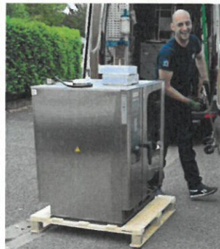
Un nouveau four pour la cantine de l'école