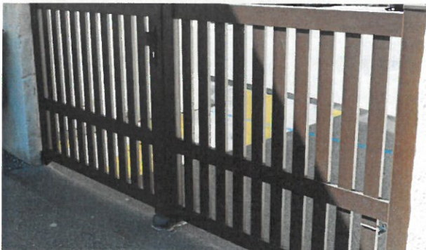
Un nouveau portail a été installé à l'école maternelle en avril dernier.