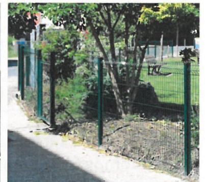
La clôture du square, désormais en grillage rigide