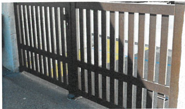
Un nouveau portail a été installé à l'école maternelle en avril dernier.