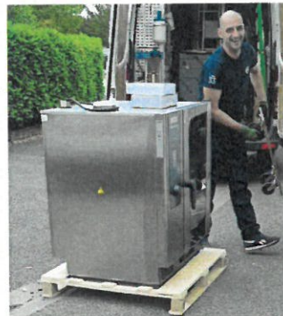
Un nouveau four pour la cantine de l'école