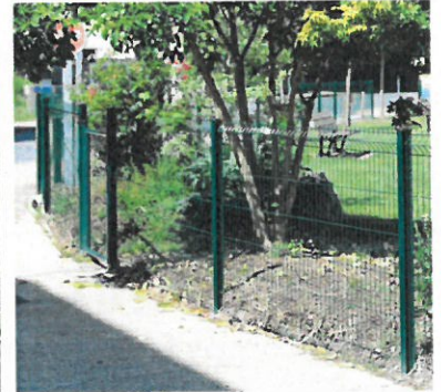
La clôture du square, désormais en grillage rigide