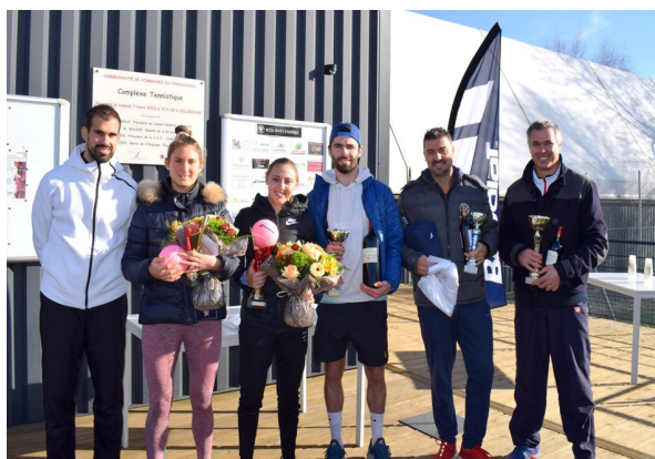
(De gauche à droite)

Le club a aussi mis en place son Loto annuel afin de diversifier les activités et faire plaisir à tous.